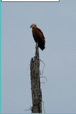
Black collared hawk

In de tuinen van Torarica en vooral Royal Torarica kun je 's morgens vroeg een wandeling over het resort maken om verschillende vogels te spotten. Bij Royal Torarice kun je de yellow-chinned spintail en pied-watertyrant zien. Je kunt ook de korte pier op lopen aan de Suriname rivier en daar zie je de nodige reigers en strandlopers . Boven de stad cirkelen diverse soorten gieren zoals de turkey vulture en de greater yellow-headed vulture .