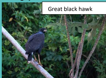
Great black hawk

leeft op de bosvloer, maar die zijn zang tot ver in de boomtoppen laat klinken. Vlinderachtige kolibries vliegen af en aan, een schitterende roodborstheremietkolibrie ( glaucus hirsutus ) blijft een tijdje vlak voor ons hangen. Er zijn veel spechten , zoals de bloedrugspecht ( veniliornis sanguineus ). Het beestje is endemisch voor Suriname en kan dus in geen enkel ander land worden waargenomen.